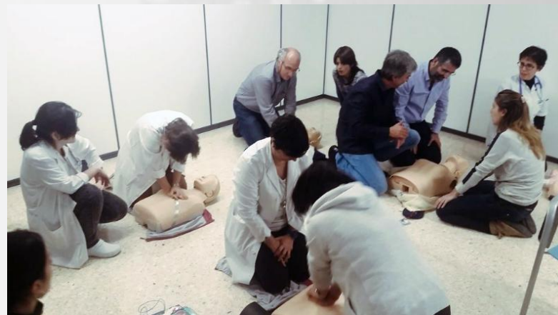
Jornada d'Actualització en RCP a càrrec del Consell Català de Ressuscitació per a tot el personal de l'EAP Sardenya.